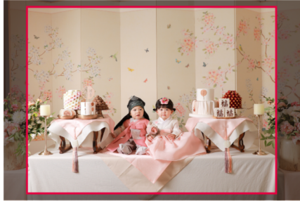
[예시] 6x8inch 직사각 액자