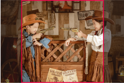
[예시] 8x8inch 정사각 액자