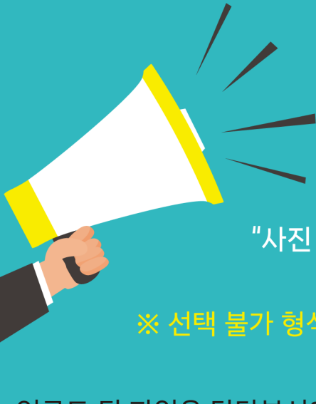
사진 선택 시, 주의 사항 꼭! 읽어주세요

앨범&액자 사진 선택은 당사에 위임할 수 없으니, 꼭 직접 선택해 주세요.