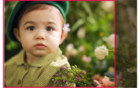
[예시] 11x14inch 직사각 액자

* 선택하신 사진이 액자 비율과 맞지 않을 경우, 사진 교체나 비율 변경 등과 관련해 디자인팀에서 고객님의 연락드릴 수 있습니다.